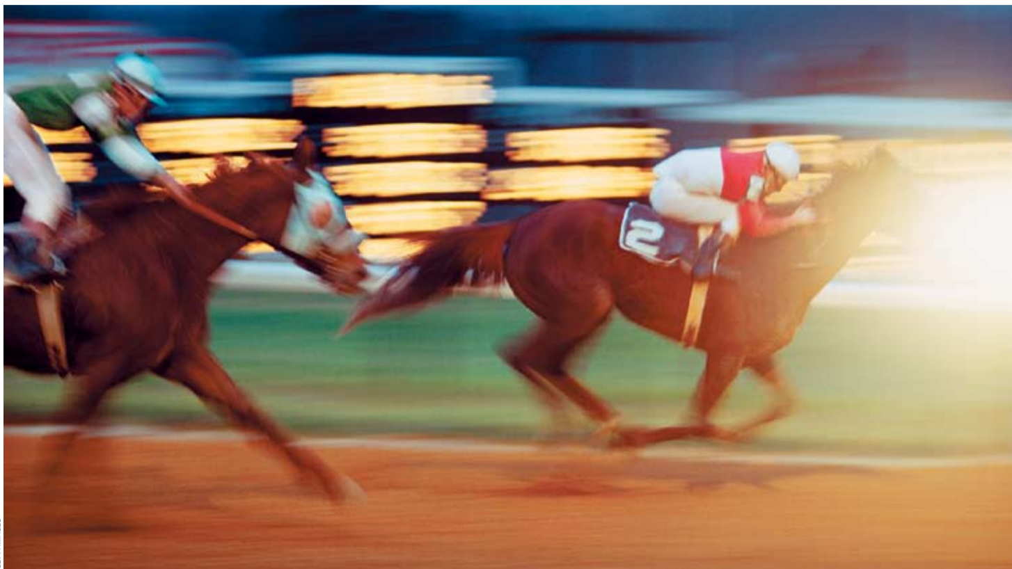
Ein hoher Anteil an Small Caps mit starker Performance hat zahlreichen Aktienfonds einen Vorsprung gegenüber dem Markt eingebracht.

Zwar findet man Novartis in den Portfolios der übrigen Spitzenreiter, doch auch sie haben auf die aktuelle Schwäche des Pharmakonzerns reagiert. «Wir haben den Wert auf ein historisches Mi-