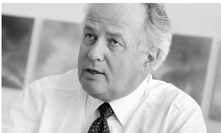
Pharmamulti Roche macht unter CEO Franz B. Humer eine gute Figur.

Tags darauf gibt der weltweit grösste Pharmakonzern Pfizer den Umsatz aus dem 2. Quartal bekannt. Der Konzern fürchtet die Generika, sobald der Patentschutz seiner Medikamente abläuft. Ein Viertel seines Jahresumsatzes hängt beispielsweise vom Cholesterinsenker Lipidor ab, dessen Patent 2011 verfällt.